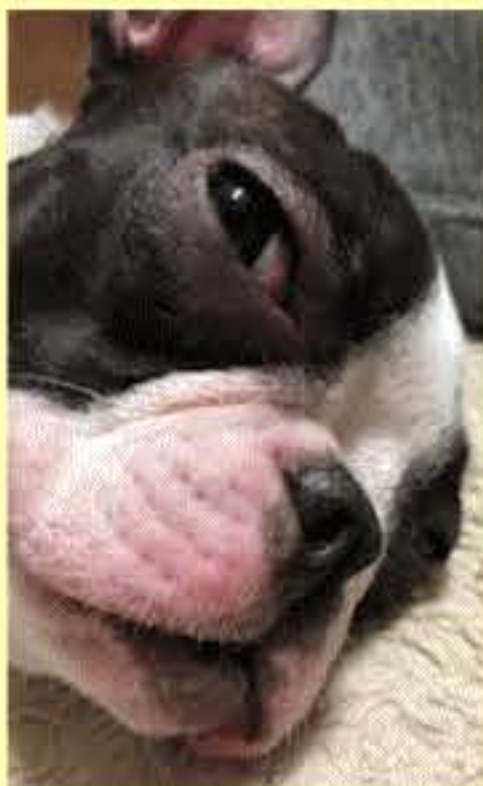
元気に毎日出勤中！