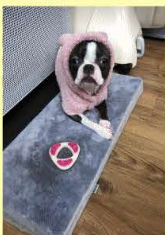
『ニコ！席までご案内して！』特訓中です。

当店は完全予約制です。いつも忙しい訳では御座いません。まれに、ご希望のお時間に予約が取れない事もございます。ごめんなさい。なので50日先までご予約可能ですので早め早めのご予約を、お願いいたします。