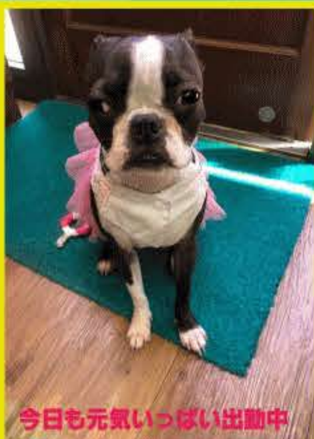
今日も元気いっぱい出勤中