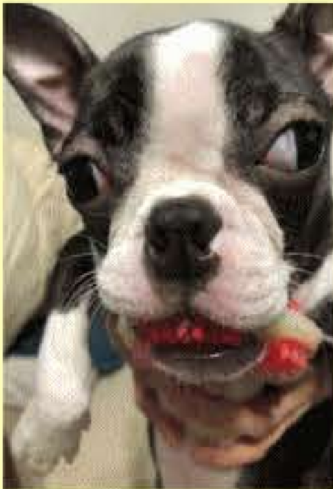
元気に毎日出勤中！