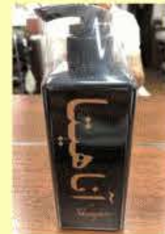
アナヒタシャンプー 500ml

当店で、スーパー再生トリートメントをされている方はこれ！2倍3倍トリートメントの持ちが良くなります。天然自然由来成分98.5%使用。