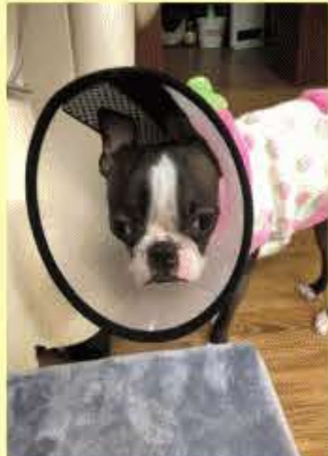
『最近、御案内ができます。』

当店は予約優先制です。いつも忙しい訳では御座いません。まれに、ご希望のお時間に予約が取れない事もございます。ごめんなさい。なので50日先までご予約可能ですので早め早めのご予約を、お願いいたします。