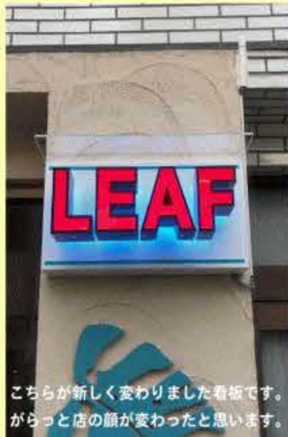
こちらが新しく変わりました看板です。がらっと店の顔が変わったと思います。